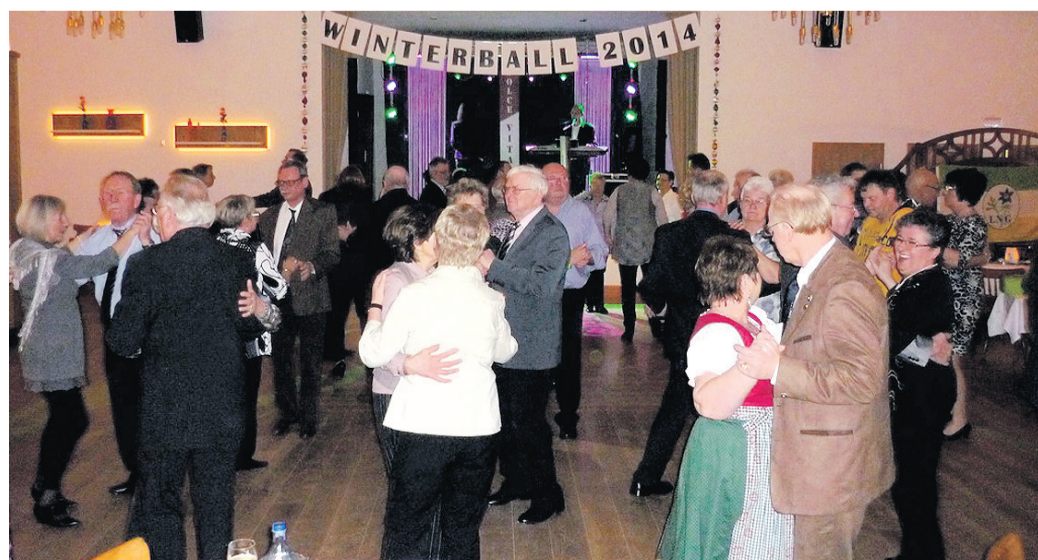
Die Tanzfläche war stets gefüllt: Viele Gäste nutzten die Gelegenheit, eine flotte Sohle aufs Parkett zu legen.