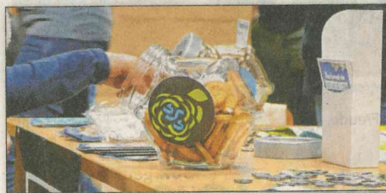
Die Gesamtschule bemüht sich, fair gehandelte Produkte anzubieten.

Am Grundschultag informiert ein Schüler über